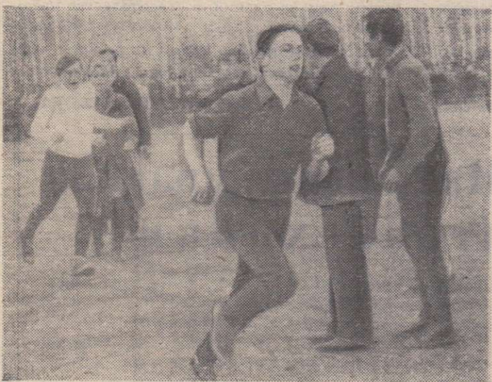
Этот снимок сделан на стадионе районного центра во время открытия летнего сезона.