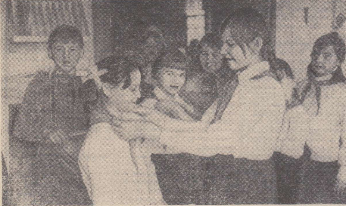
Радостное событие произошло в жизни многих учеников Держинской начальной школы №1 накануне окончания учебного года. Их приняли в пионеры.